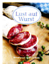
Der schreibende Metzger: „Lust auf Wurst“ (Mosaik, 19,95 Euro)

Unterwegs hat der barocke Sachse Zeit zu philosophieren: Dass gute Wurst weder Brot noch Butter braucht. Dass ihr Knoten ein Kunstwerk sein muss. Und ein Lehrling Zeit kosten darf – damit er eines Tages die Fackel der Metzgerskunst weiterträgt.